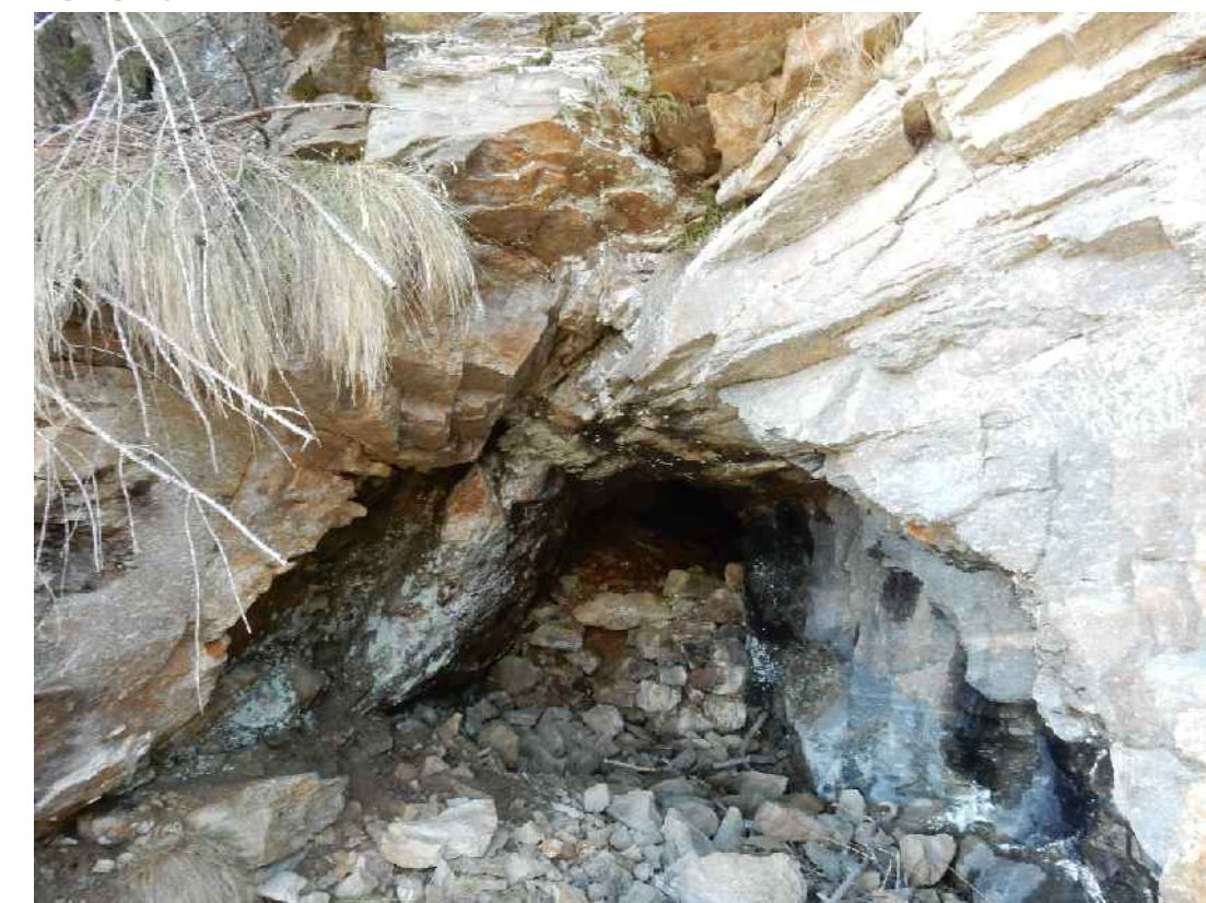
FOTO esempio antincendio