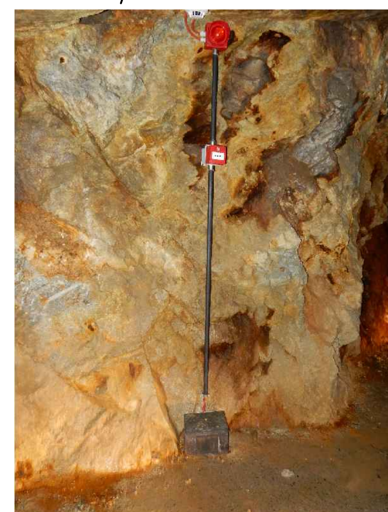
FOTO esempio telecamera